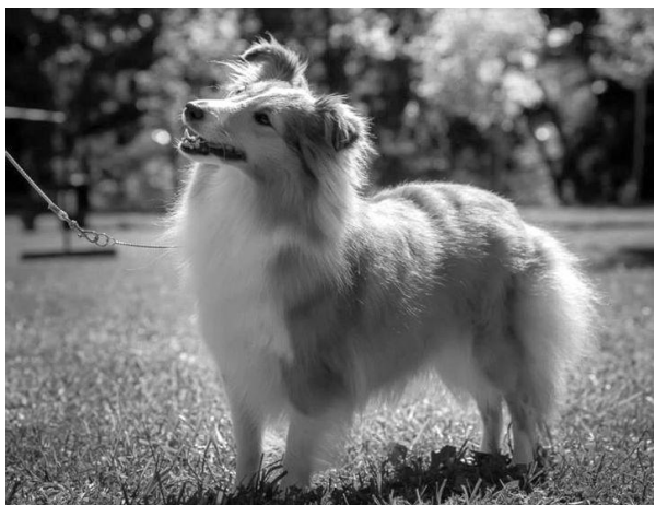
Altamíra Shetlandská hvězda Dospělá fena r. 2014