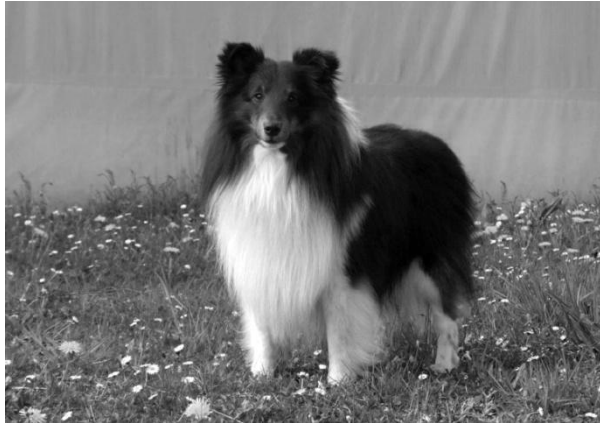
My Grand Illusion Navarette Dospělý pes r. 2014