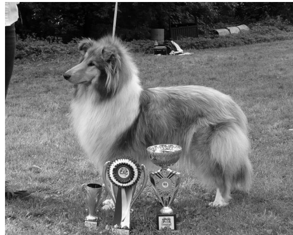
Ch. Giulia d'or Lago Benea Dospělá fena r. 2014