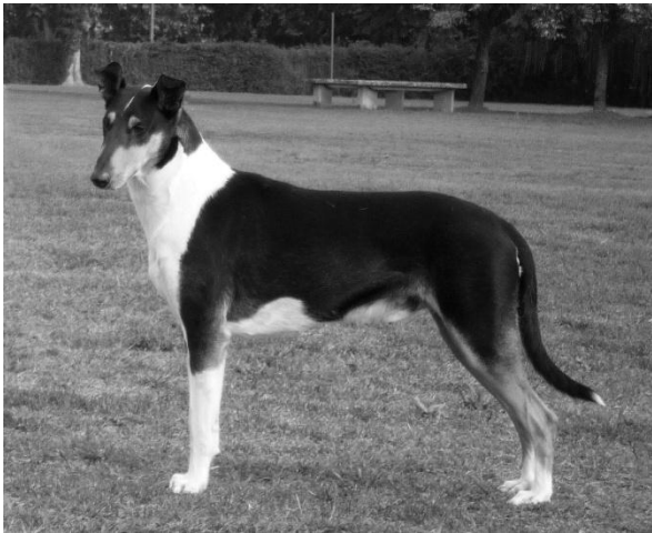
C.I.B. Neo Krásná louka Dospělý pes r. 2014