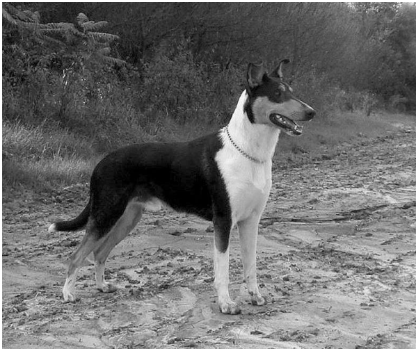
Mighty's Spring Meadow le Ilario Mladý pes r. 2014