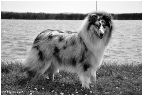
Alviero Silver Dream Celestial Glamour Mladý pes r. 2014