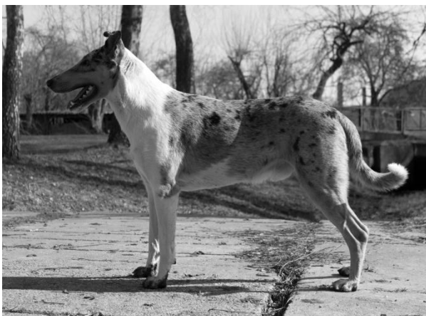
Armani Daff Fun dog Dorost r. 2014