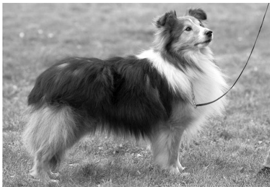
C.I.B. Amethrickeh Apparation Veterán r. 2014