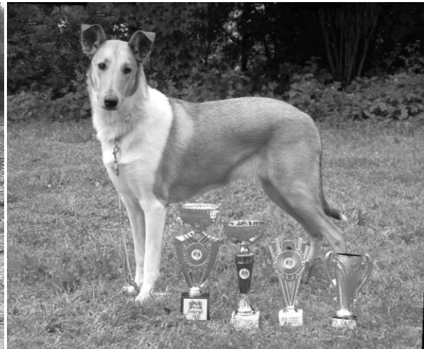
Mighty's Spring Meadow le Isis Mladá fena r. 2014