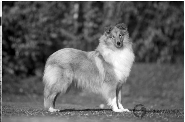
Evr. v. ml., Jeopardy Ever After Mladá fena r. 2014