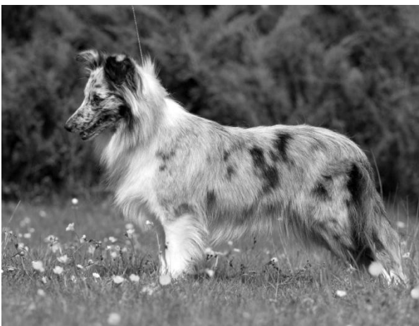
Jch. Fortune Tinklebelle Mladá fena r. 2014