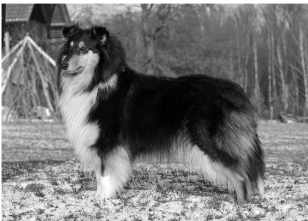
JCh. Annick Noir Brilliant Celestial Glamour Dorost r. 2014