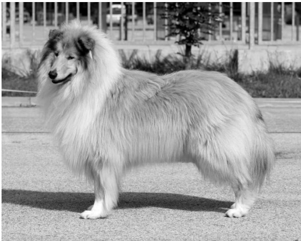
C.I.B. Arpad Gold Vorašif Dospělý pes r. 2014