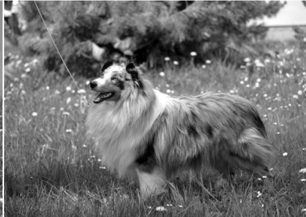
Just Not Spotless da Casa Mont' Alves Mladý pes r. 2014