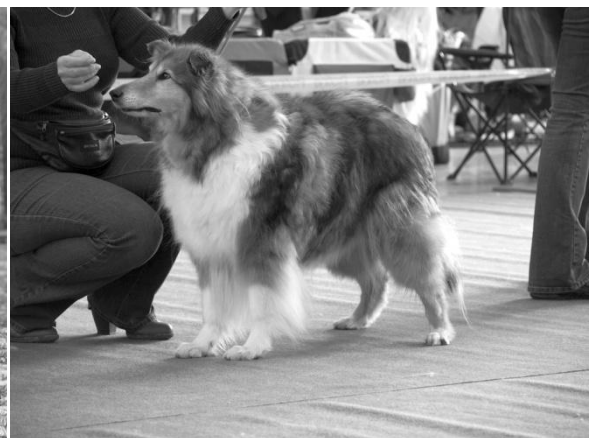
Vet. Ch. My First Love ze Zlaté Jalny Veterán r. 2014