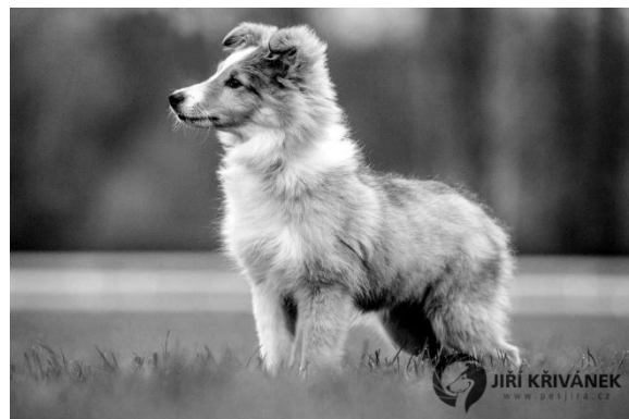
Fixed Star z Ďáblovy studánky Dorost r. 2014